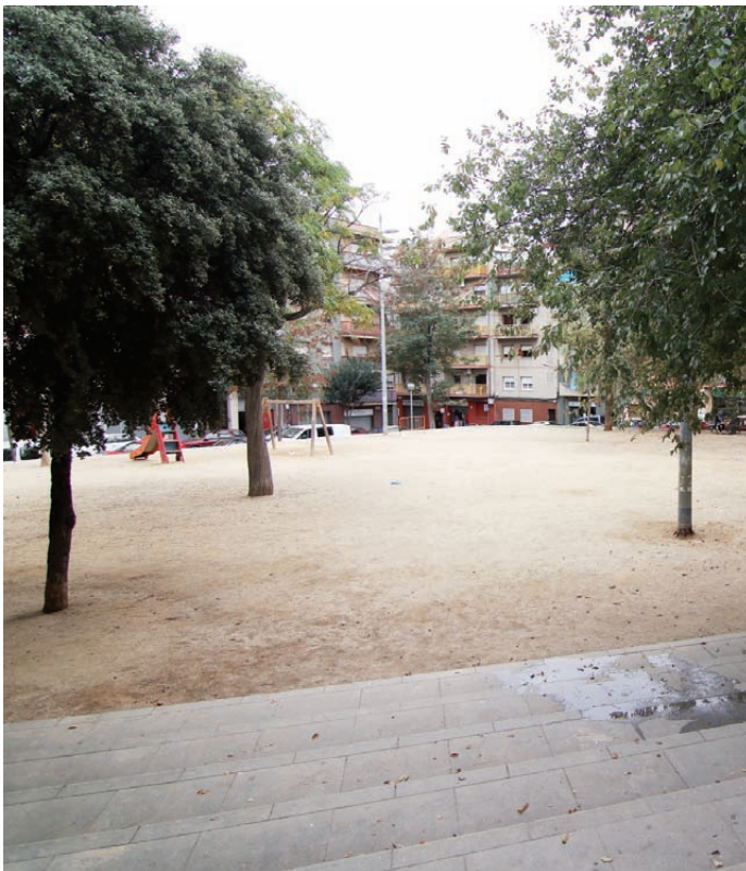
La plaça canviarà lleugerament

El projecte de millora de la urbanització de la ronda de Miguel de Cervantes preveu actuar en el tram de 575m comprès entre la plaça d'Alfred Opisso i el carrer de Francisco Herrera. El total de la superfície d'actuació és de 12.500 m². Es preveu la creació d'un passeig per a vianants al costat de la riera de Sant Simó que connecti amb el front marítim. La reordenació contempla l'ampliació de voreres; la millora de l'accessibilitat i consolidació de vuit passos de vianants; la implantació de nou enllumenat al passeig amb columnes de 5m i llums led; entre altres actuacions.